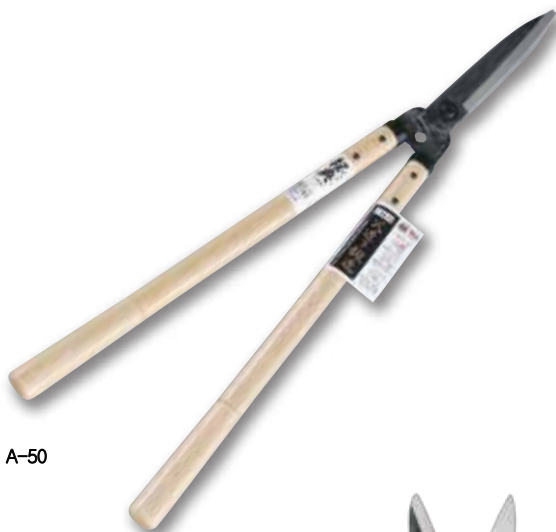
A-50 165mm 강철 원예 가위 단조제품

■ 사이즈 / 날 : 165mm 그림 : 450mm 중량 : 910g 전장 : 665mm ■ 재질 / 날 : SK · 날붙이용 탄소강 그림 : 맥갈나무 ■ 입수수량 / 12ea ■ JAN CODE / 4953821 100236