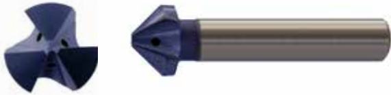
オイルホール付き