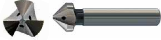
オイルホール付き