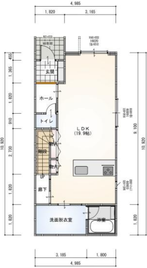
1階 平面図 S:1/100