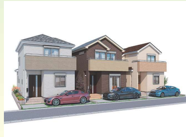
※イメージベース 実際のものとは多少異なります